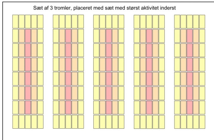
Figur 2, Placering af tromlesæt i hal

Jumbocontainerne har en relativt høj aktivitet på ydersiden, og de placeres derfor i et afskærmet område, hvor afskærmningen bygges på stedet af ½ m tykke betonblokke, der kan stables så de griber fat i hinanden som dubloklodser – kaldet for "megaduplo" betonblokke. Containerne placeres inden for afskærmningen med indvendig afstand/gangbredde på 0,8 m.