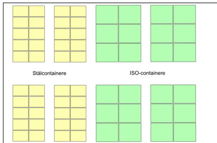
Figur 1, Placering af stålcontainere og ISO-containere i hal

Containerne stables parvist i rækker med en 1,3 m bred inspektionsgang imellem de parvise rækker. Rækker placeres på tværs i hallen, og der efterlades en 3,0 m bred adgangs- og løftegang på langs i hallen, således at der kan udtages containere fra alle rækkerne fra midtergangen. Rækkerne bygges helt ud til sidevæggene i hallen.